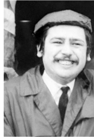
Az örökvidám Dondász