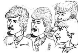
A jászárokszállási SIEMENS zenekar