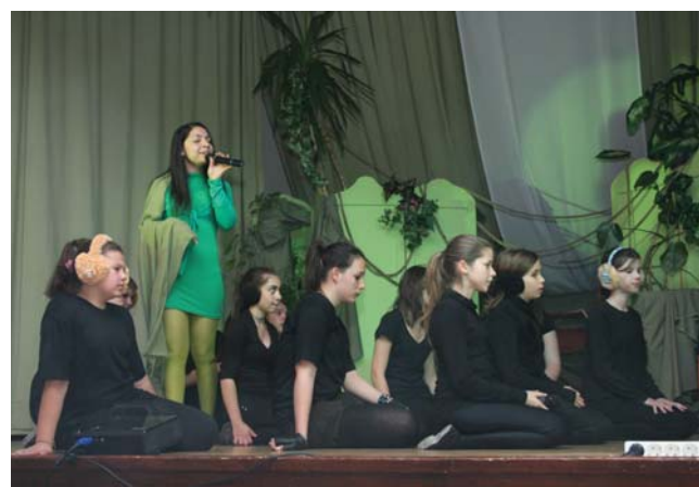
A Nevesincs Színkör egyik sikeres darabjában

kérdésére válaszolva elárultad, hogy Zorántól a Kell ott fenn egy ország című dalt azért választottad, hogy beteg testvérednek énekelj, neki adj erőt. Tetszett neki a produkció?