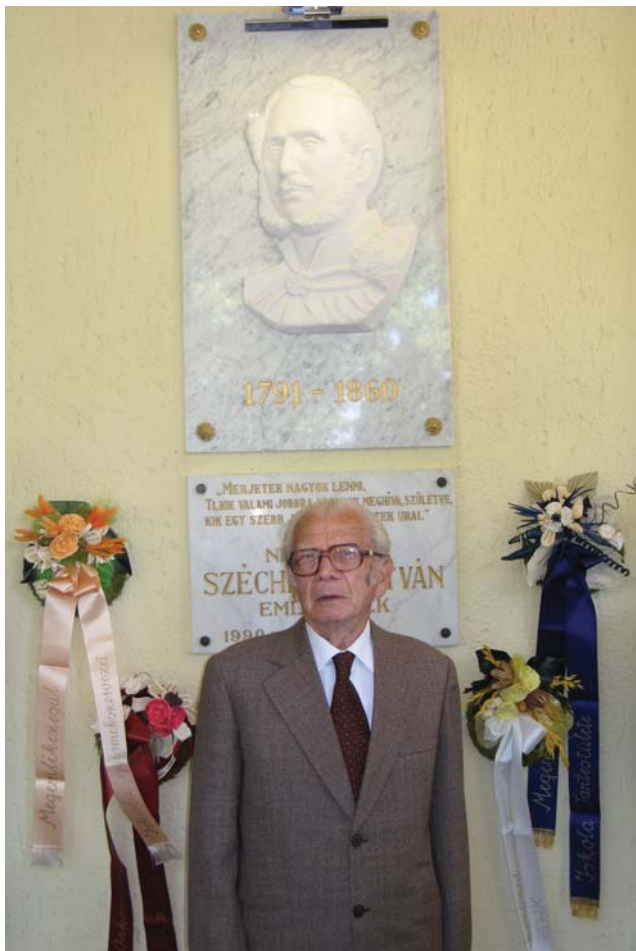
A mű és alkotója