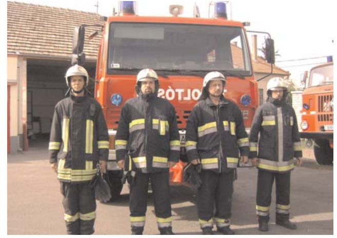
A Jászárokszállási Önkormányzati Tűzoltó-parancsnokság tiszteletadása látható

A júliusi lapzártá óra eltelt időszakban összesen 38 káreset történt (Jászágó, Tarnaörs, Visznek, Vámosgyörk, Jászárokszállás településeken). Két esetben történt műszaki beavatkozás, 6