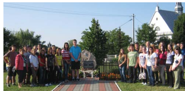
Emlékezés a bősökre

Bármerre jártunk, elkísért bennünket az odaadó lengyel vendégszerető. Minden programon külön kísérők vigyáztak ránk. Ezen kívül a tolmácsunk mindenhol velünk jött, és ha kérdésünk volt, mindig örömmel válaszolt rá. Az ország látványosságain kívül alkalmunk nyílt beleköszölni a lengyel konyhába. Egyszer egy hivatalos díszbeneden is részt vettünk Opatowban, ahol a környék képviselői köszöntöttek bennünket. Nagy meglepetés ért minket, amikor az egyik képviselő magyar nyelven üdvözölte a csoportot. Az utolsó este, pénteken a lengyelek grillpartival készültek. Itt találkozhattunk azokkal a fiatalokkal, akik hozzánk, Járározásosra látogattak el. Nagyon sok kedves lengyel