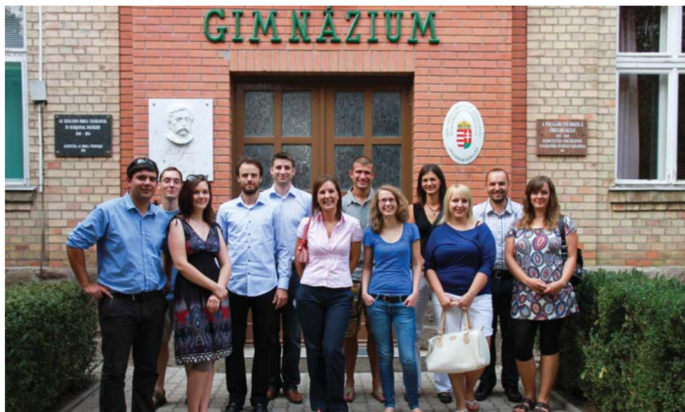
Akik nem késtek el az osztályfőnöki óráról