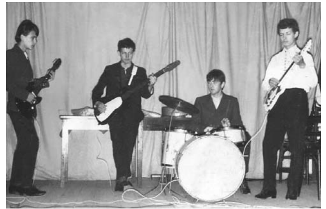
Próba közben a Gagarin színpadán