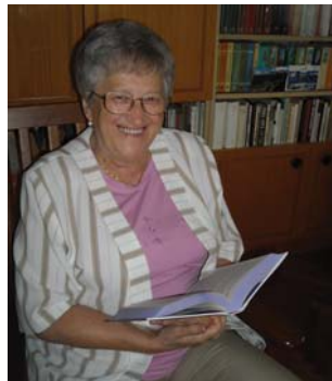
Egy újabb jó történet, mely örömet okoz