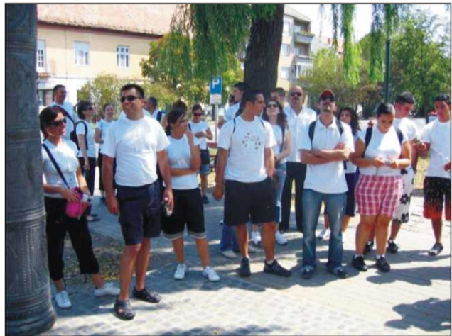
A városközpontban ...