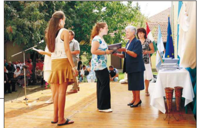
A Hazánk titkai pályázat eredményhirdetése