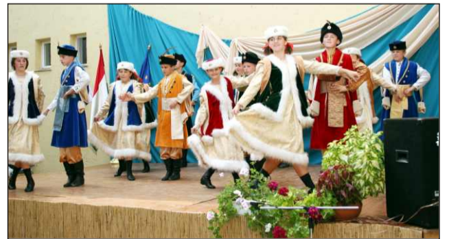
A lengyel néptáncscsoport a színpadon