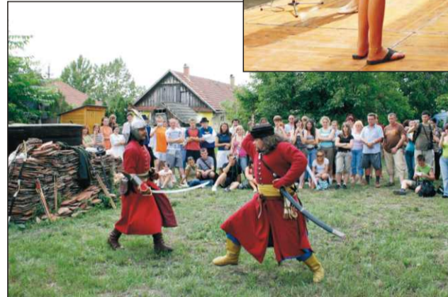
Nagy érdeklődéssel nézték a párbajt

A helyi tábor programját városunk önkormányzata mellett egy sikeres Európai Unió pályázat is támogatta.