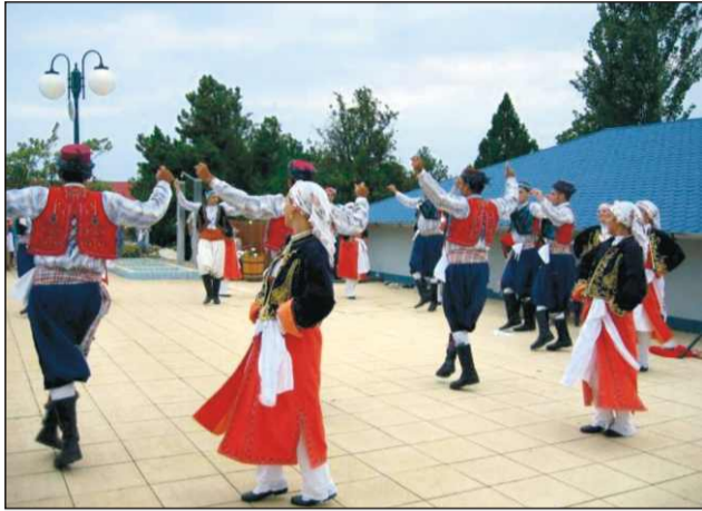
Színvonalas műsor a strandon

Az észak-ciprusi együttes 2001-ben alakult és jelenleg 5 csoporttal működik. Fő