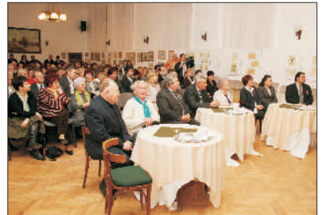
„Pilvax kávézók”, majd interaktív szereplők