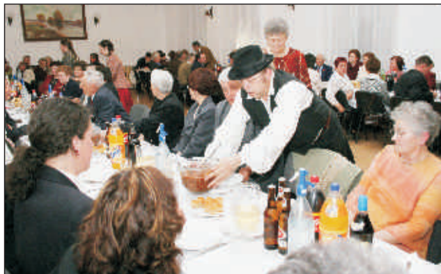
Tálalás az 1.848 Ft-os vacsorához