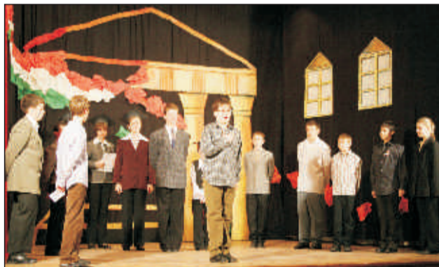
Forradalmi jelenet 1848-ból

most egyesülő Európában sem lehet megfelelő képviselő a megosztott pártharcoktól hangos, viszályokkal terhelt nemzetnek.