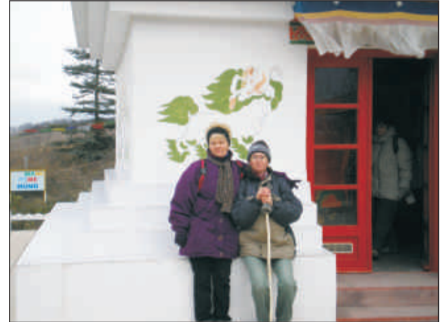
Tar, Sztúpa, Zsófi és Anyu

Mégis mi volt az egészben a legszebb? Rajtam termo, polar réteg, egy 4 kilométeres alattomos felfelé részen. Hátrafordulva látom Sántát, mögötte pedig egy lányt, aki egy topban zúzza felfelé! Na, Ő sem a fitnessztermek