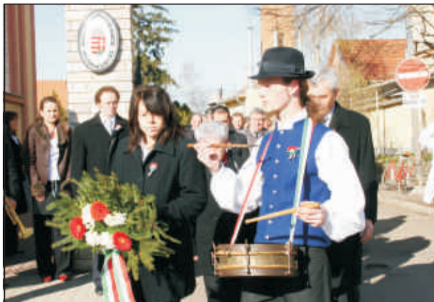
Dobpergésre az emlékezéshez

Ha erősen él bennünk egy szebb, szabadabb jövő reménye és képesek vagyunk együtt, egymásra támaszkodva nekirugaszkodni a megvalósításnak, méltók leszünk 1848 örökségéhez.