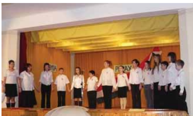
A márciusi forradalomra emlékezve