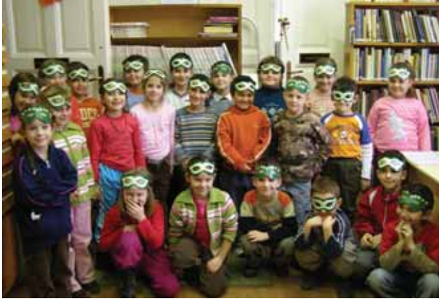
Most már kezdődhet a farsangi bál (1. a osztály)

A jászárokszállási Városi Könyvtárban immár hagyományává vált, hogy a gyermekek számára közelebb hozzuk az év jeles napjait, egy-egy foglalkozással észrevétlenül is fejlesztve kreativitásukat, kézügyességüket.