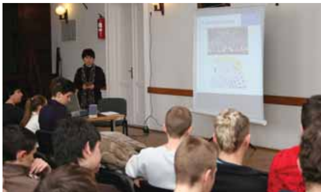
„Legyen a zene mindenkié!”