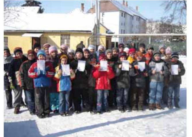
Eredményes volt a felkészülés