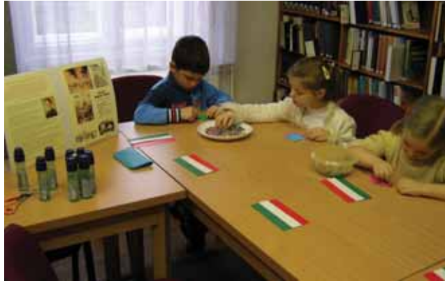
A legfiatalabb „márciusi ifjak”

élményt nyújtott. Márciusban együtt készültünk a Lehel úti óvodá-