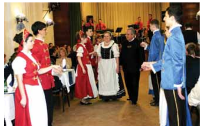
A jászkapitány bevonulása