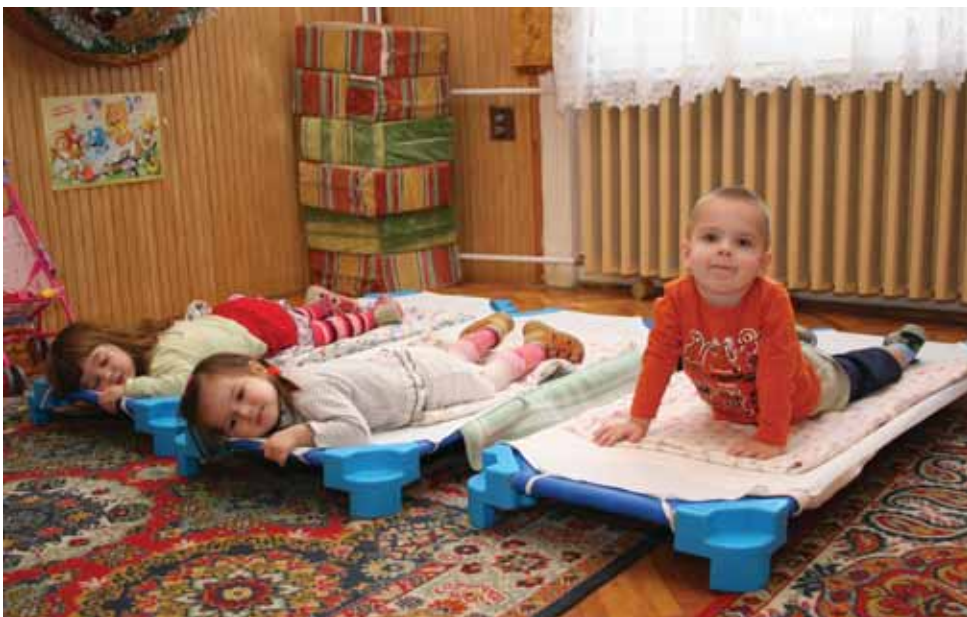
Új francia ágyak a bölcsődében

Ez a hivatalos megnevezése annak az intézménynek, amiről tudjuk, hogy évek óta van és működik, és egyre szélesebb körű ellátást, és egyre színesebb programokat biztosít az igénybe vevők számára. Mégis, akik nem érintettek az intézmény tevékenységében – és azok vagyunk sokkal többen – azt kell mondanunk, hogy alig vagy csak na-