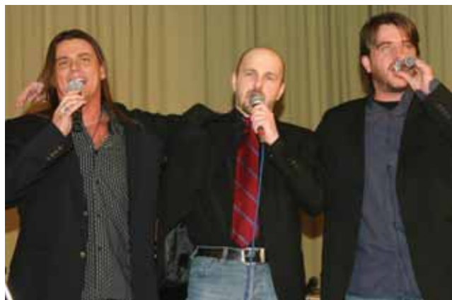
A "Társulat" művészeinek műsora

Az este folyamán nagy sikere volt a „szerencsesüti-nek” is, amellyel a szervezők kedveskedtek. Az a 13 szerencsés bálzó, akinek a süteményében kis cetlin a 13-as szám szerepelt, külön ajándékot vehetett át. Érdemes volt azonban szerencsét próbálni a tombolasorsoláson is, hiszen jócskán érkeztek önzetlen, értékes felajánlások. Szerencsésnek azonban bárki érezhette magát, hiszen a finom vacsora, a színvonalas műsor, a hangulatos zene, a baráti tár-