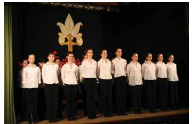
Jelenet az ünnepi műsorból