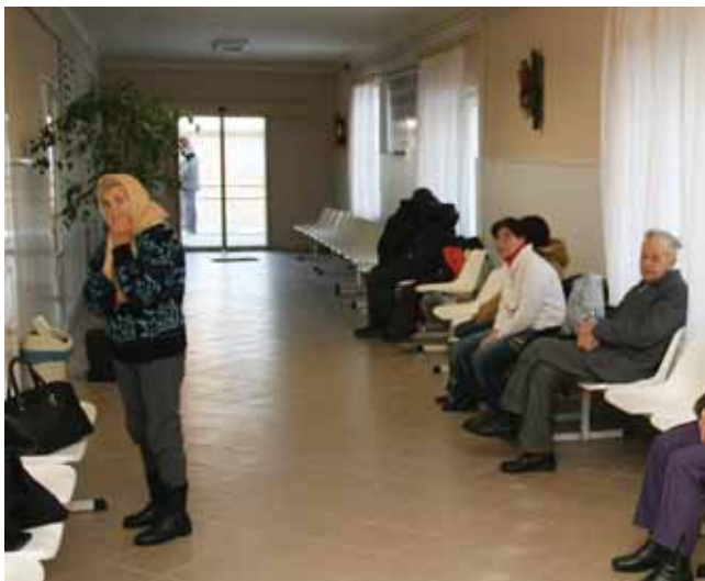
Csendélet a Családsegítőben