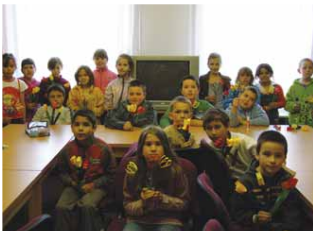
Anyák napjára készülődők