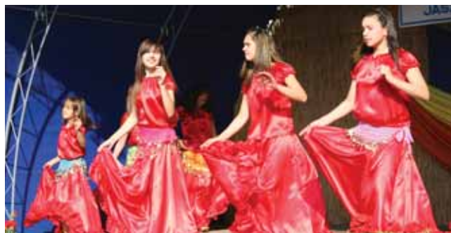
Piros pipacsok a színpadon

1984. november 7-én 50 éves önkéntes tűzoltói szolgálatának elismeréseként Aranykoszorús Érem kitüntetésben részesült.