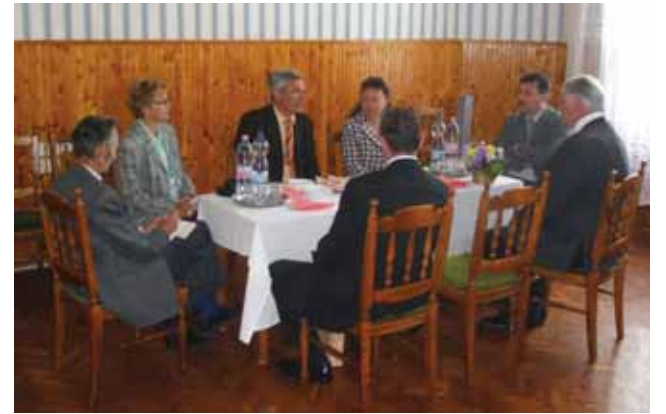
A delegáció a város képviselőivel

Hangsúlyozták, hogy rövid látogatásuk alatt is sokat tapasztaltak, és használható