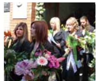
Ballag a 12. a

Legyen ünnep a mai nap! Bontsunk pezsgőt, ünnepeljünk a családdal, barátokkal. Megérdemeljük, nagy dolog idáig eljutni. A sportolók is pihennek a nehéz meccsek előtt. És a szalagavató óta tudjuk, hogy ránk még vár a második féldió. Hétfőn 8 óra 00 perckor tehát mindenki a csúcsformáját nyújtsa!