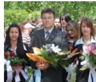
Ballag a 12. b

Az eltelt négy év alatt nemcsak mi változtunk, az iskola neve is: Deák Ferenc Gimnázium, Közgazdasági és Informatikai Szakközépiskola lett. Hosszú, a legtöbb helyre ki sem fér. Ezért sokan úgy hívtuk: a Gimi. A Gimibe jártam négy, néha elképesztően hosszúnak, néha piszkosul rövidnek tűnő évig.