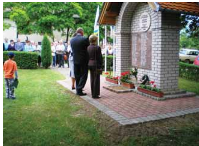
Tiszteletadás a Jász emlékműnél

visszaköltözés gondolatát. Az odakerkezésnél újra a vízi utat választottuk. Mit nekünk a szépívű híd.