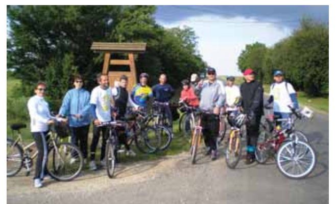
Kerékpáron jöttek elénk

11. alkalommal kerekeltünk Újiregre és első alkalommal vehettünk részt az Újiregről elszármazott jászárokszállásiak találkozóján. E program keretében 22. alkalommal került színpadra a Görbe János Színkör ez évi színadarabja a Nyitott ablak.