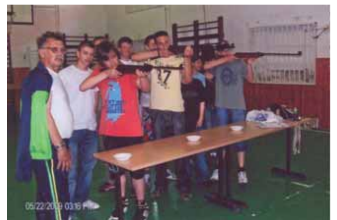
Csak pontosan célsoz!

tetése után a diákok fejelemzetten vetélkedve alkították ki az egymás közötti