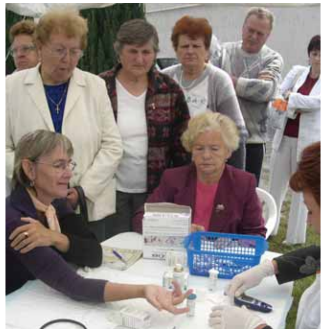
450 regisztrált látogató vett részt a szűrővizsgálatokon

ma, akiknél magas volt a normális értékektől való eltérés. A vizsgálatok során hasznos tanácsokkal látták el az érdeklődőket. A szűrővizsgálatokon résztvevők ajándékot kaptak, melyet a Szent Margit Gyógyszertár és a TEVA Izraeli Gyógyszergyártó és Forgalmazó cég biztosított.