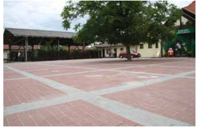
Tágas piac placc