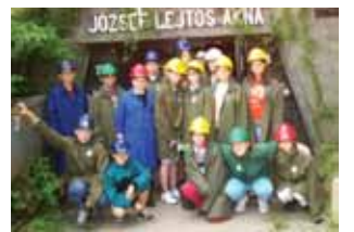
A salgótarjáni Bányamúzeum előtt

dulásának keretében használta fel a nyereményét.