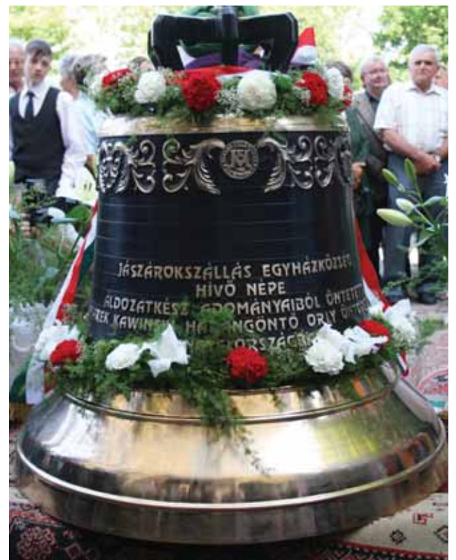
Az új harang a támogatók gyűrűjében