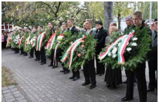
Koszorúzó az emlékmű előtt

ti: 1956-ban létezett a nemzeti egység, ugyanakkor azonnal felteszi a kérdést, vajon vesztés forradalom volt-e?