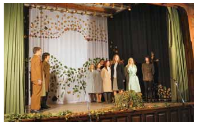
Jelenet az ünnepi műsorból