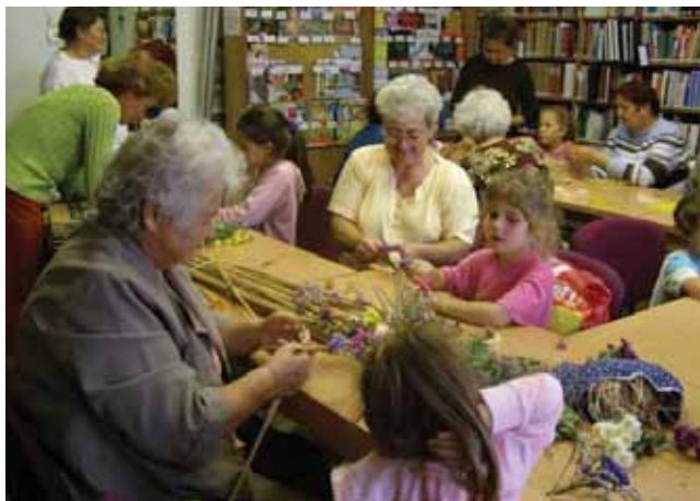
Készülnek az alkotások