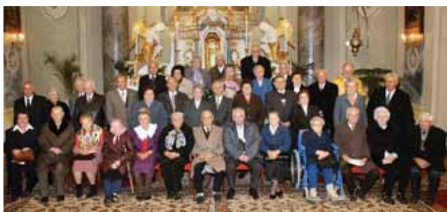
50 és 60 éves jubiléus házaspárok