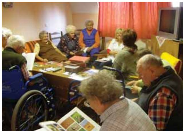
Házhoz ment a könyvtár