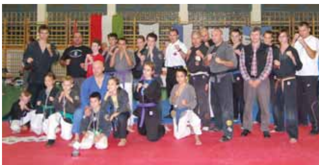
Az Árok Kempo csapata és a bajnokság bírái

A bajnokság három páston zajlott, így a közönség nem panaszkodhatott, látni-