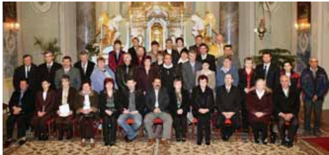
25 éves jubiléus házaspárok