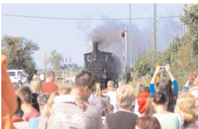
... és jött a gőzös