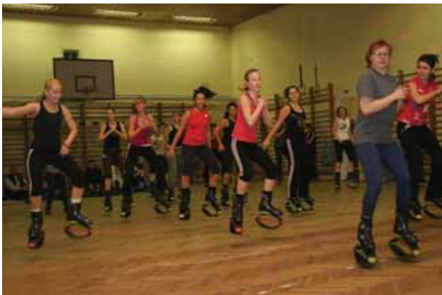
Kangoo Jumps Jászárokszállás "kenguruk"