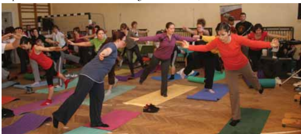
Összpontosítanak a gerinctréning résztvevői