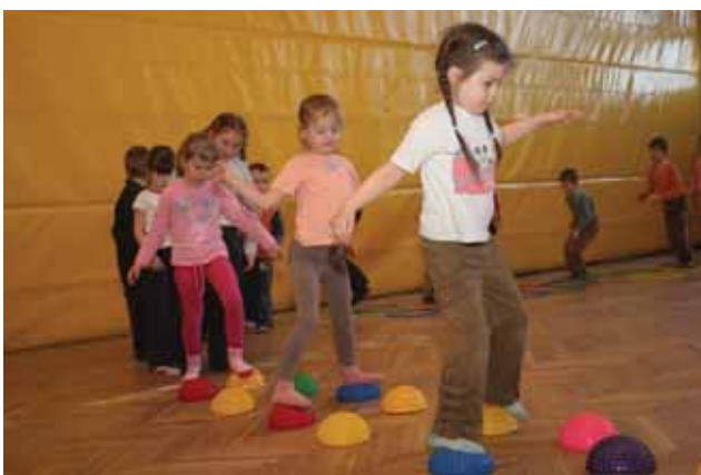
A gyerekek is fittekk lettek