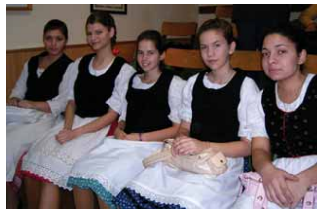
A Gyöngyharmat kamarakórus tagjai