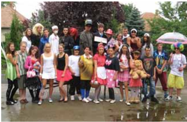
Az egyik nagy csapat – az általános iskola vidám ballagói

Ballagó diákjaink a 8 év alatt igen sokrétű tevékenységben vettek részt, számos területen mérték meg magukat. Mi hallgatók csak csodálkoztunk, hogy a kiváló tanulmányi munka elérése mellett hogyan jutott idejük ily sokféle versenyen kiváló eredményt elérni, spor-