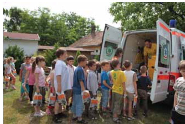
Ritka pillanat – a mentőautó, mint kiállítási tárgy