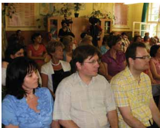
A résztvevők és a segítők

A pedagógusok felkészítő tanfolyamon vettek részt, (30 nevelő, két csoportban, 10-10 órában) ahol elsajátíthatták, illetve bővíthették ismereteiket az interaktív táblák