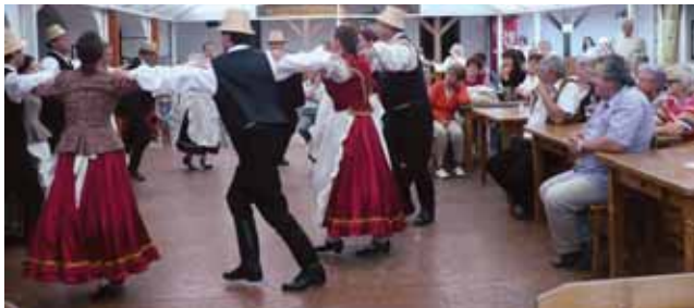
A 10 éves Parázs a 10 éves árokszállási fogadóban Szentendrén