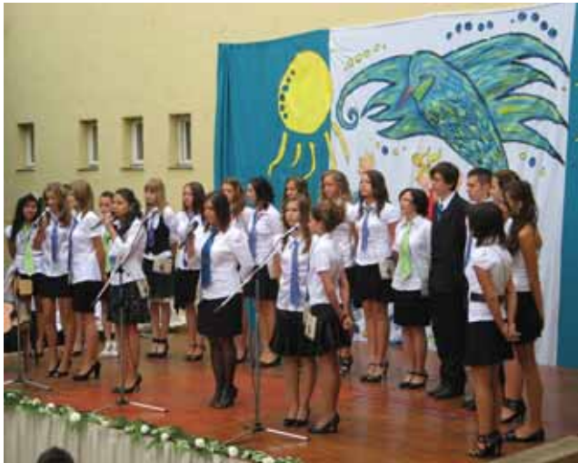
A vigyázó kékmadár

tolni, zenélni, énekelni, szavalni, pályázatokra pályaműveket készíteni, melyeken országos eredményeket értek el.