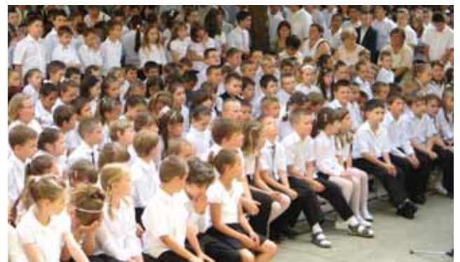
Vajon milyen lesz a bizonyítványom?